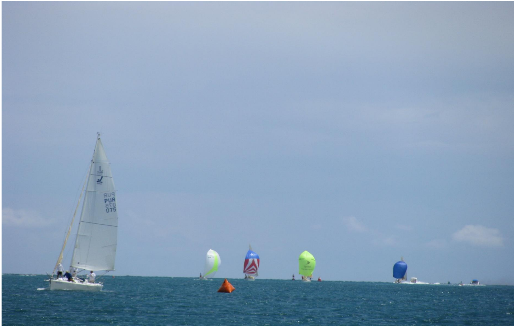
Veleros de la “Heineken International Regatta”