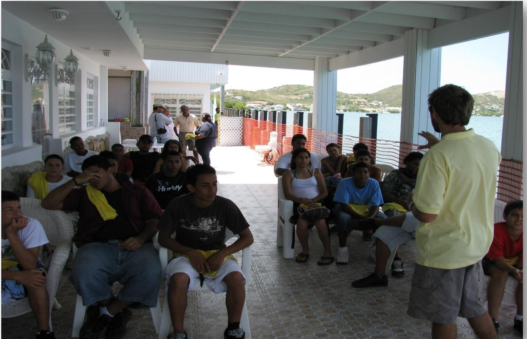
Grupo de la escuela pública de Culebra tomando su primera clase teórica de vela.