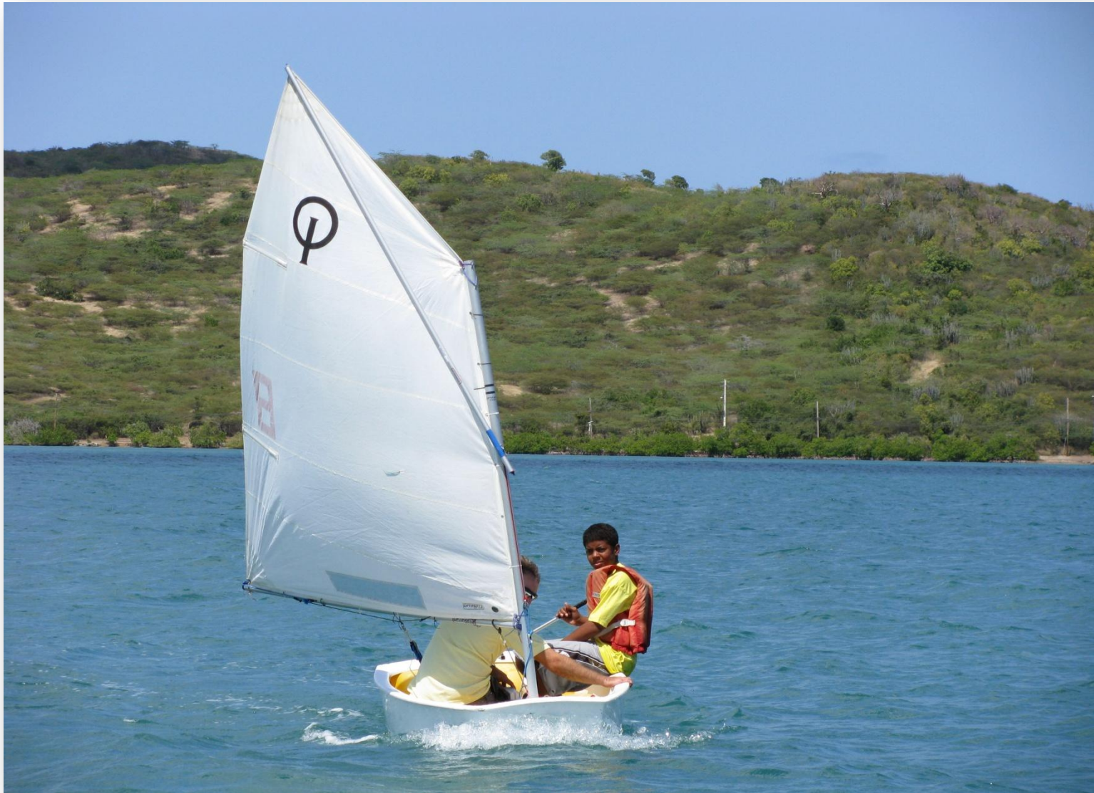
Niño tomando su primera clase de vela en un Optimus.