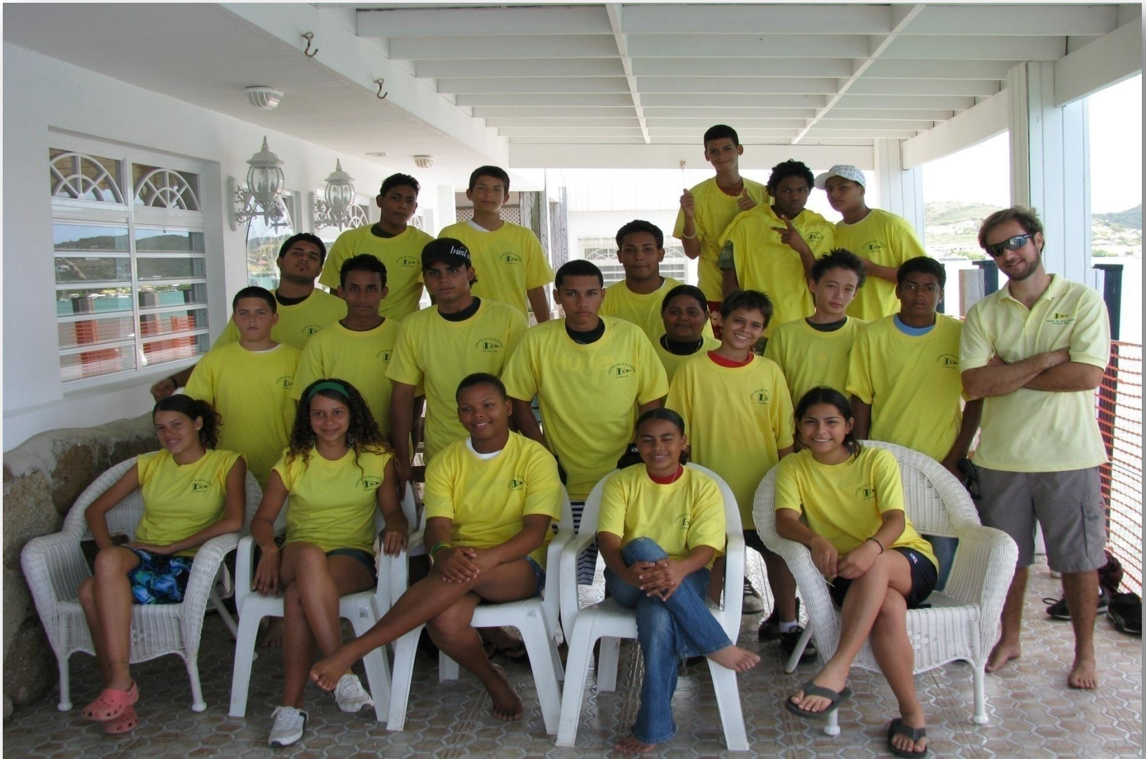
Grupo de escuela pública de Culebra.