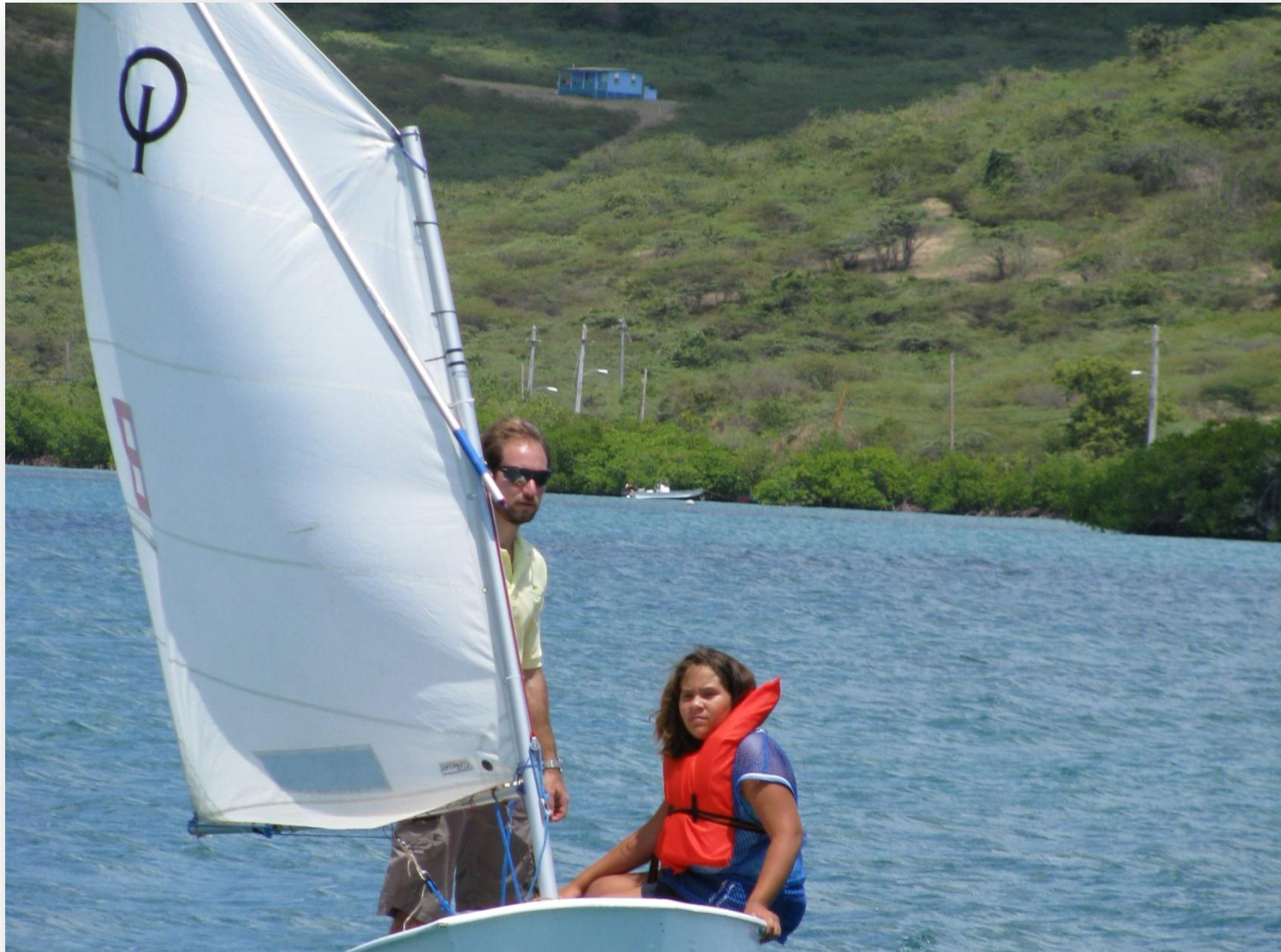
Niña tomando su primera clase de vela.