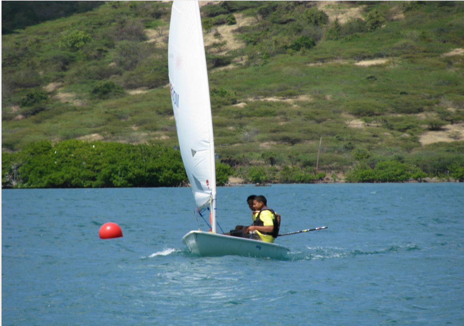
Dos niños navegando solos por primera vez en un Laser.