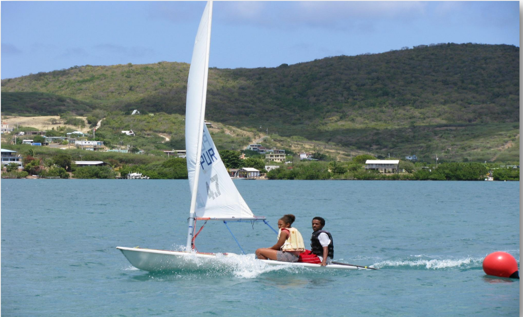
Niños de la escuela privada navegando solos por primera vez.