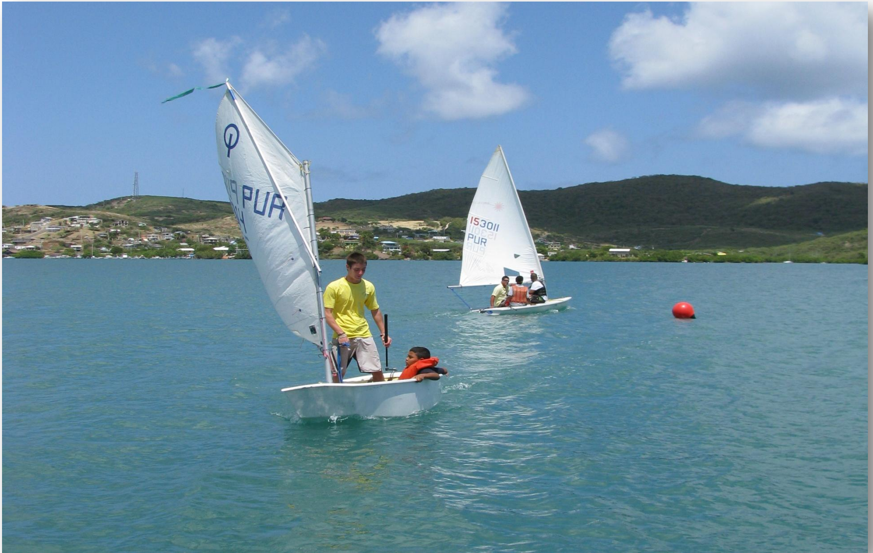
Niño de 8 años tomando su primera clase de vela en un Optimus.