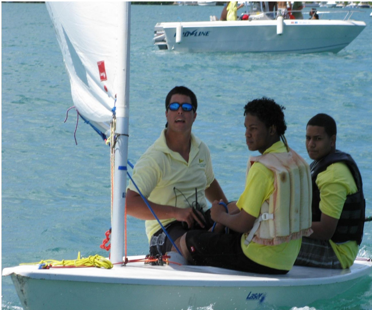
Niños tomando su primera clase de vela en el agua.