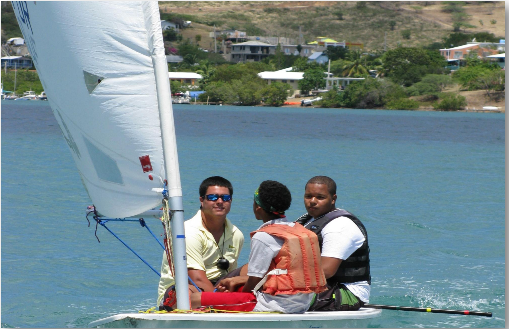
Dos niños de 15 años tomando su primera clase vela en un Laser.