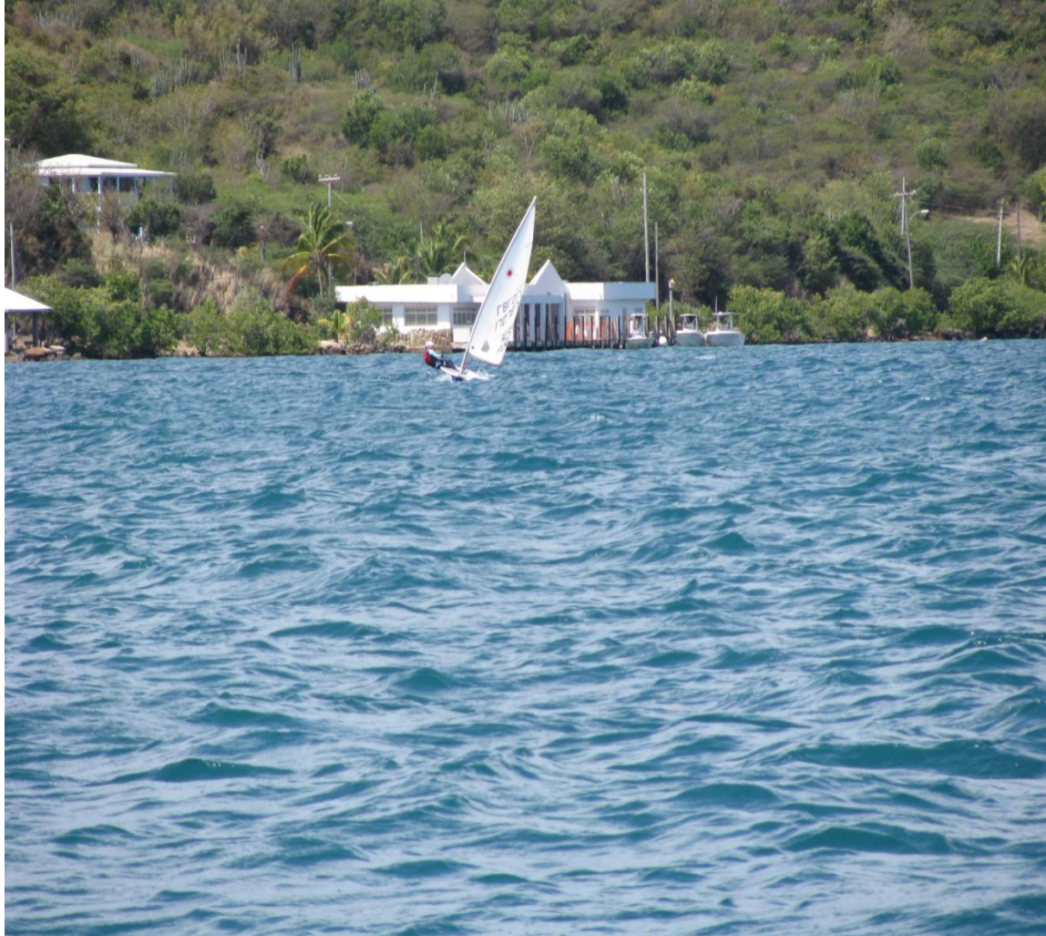
Laser compitiendo frente a la fundación